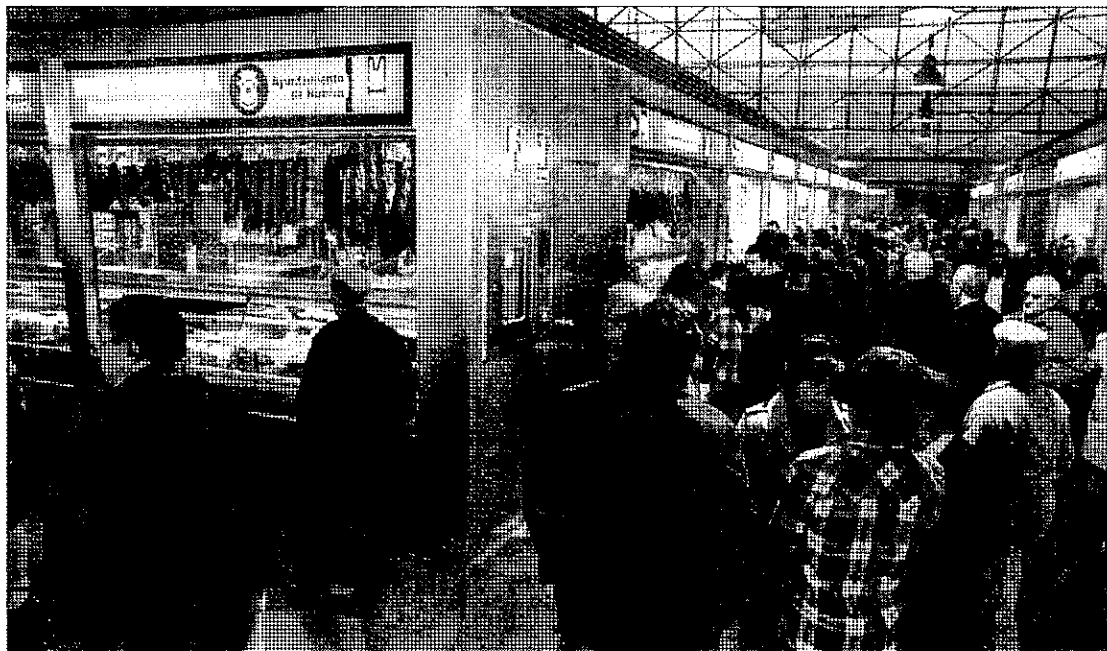
Un buen número de onubenses pasó por las instalaciones un día antes de abrirse al público para la venta.