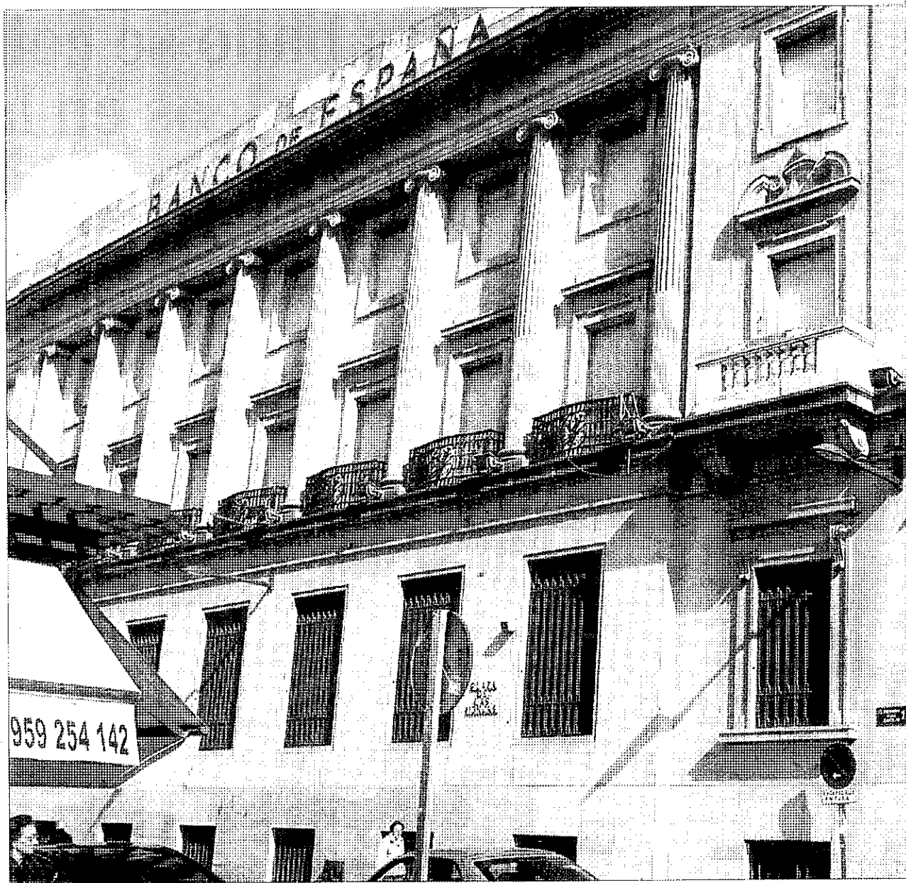
El edificio del Banco de España sigue cerrado a cal y canto desde hace seis años después de que la Junta pagara por él 3,75 millones d

tivas, un edificio multifuncional público, así como plazas y zonas peatonales más un parking subterráneo. Otro edificio inútil es el que acogió la Delegación Provincial de Hacienda, frente al Ayuntamiento, cuya historia es, si cabe, más rocambolesca. En 1997, la Junta de Andalucía, que había recibido como pago de una deuda del Conde de Santa Coloma la titularidad de la Casa de las Conchas de Salamanca, planteó al Gobierno central intercambiarla por un paquete de inmuebles de propiedad estatal entre los que estaba incluido éste de la plaza de la Constitución. Finalmen-