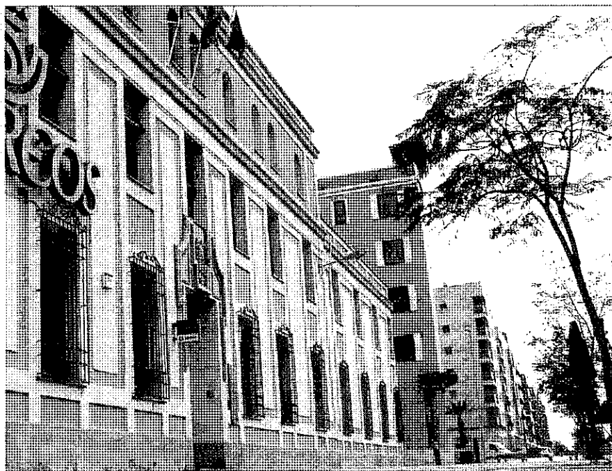
sado centralizaba los servicios de Correos en la provincia.